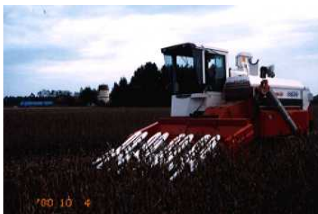
汎用型コンバインによる収穫