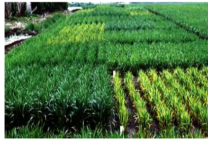
コムギ縞萎縮病の病徴(左：黄化、右：カスリ状の縞)