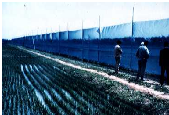
偏東風地帯で実施されている防風網