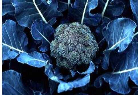
花蕾腐敗病による花蕾全体の腐敗