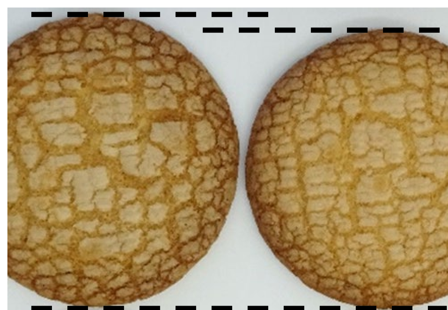
北見95号 きたほなみ