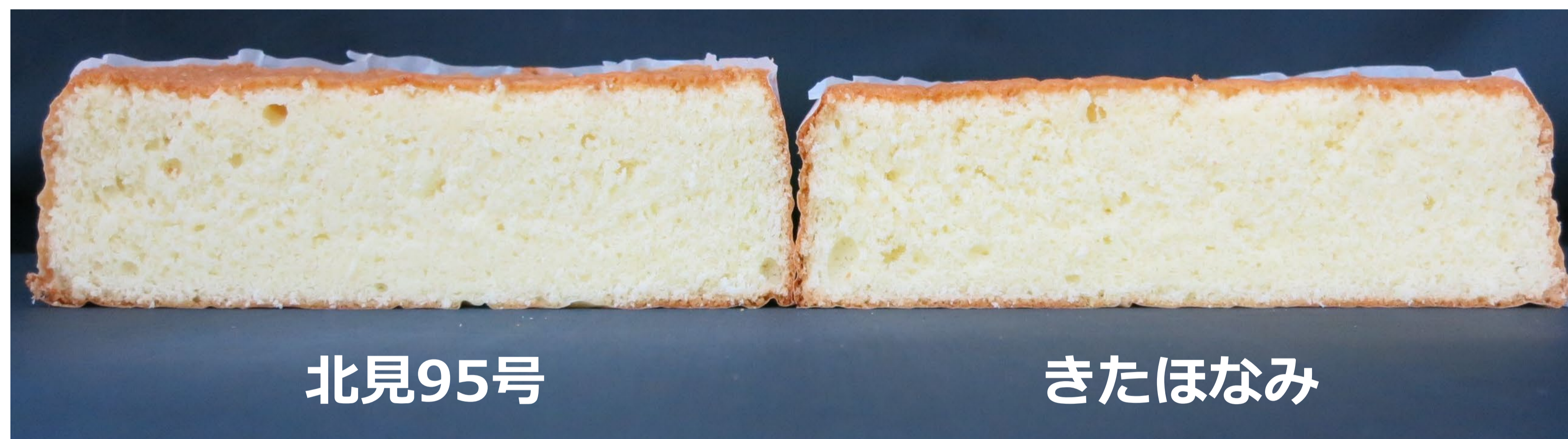
北見95号 きたほなみ