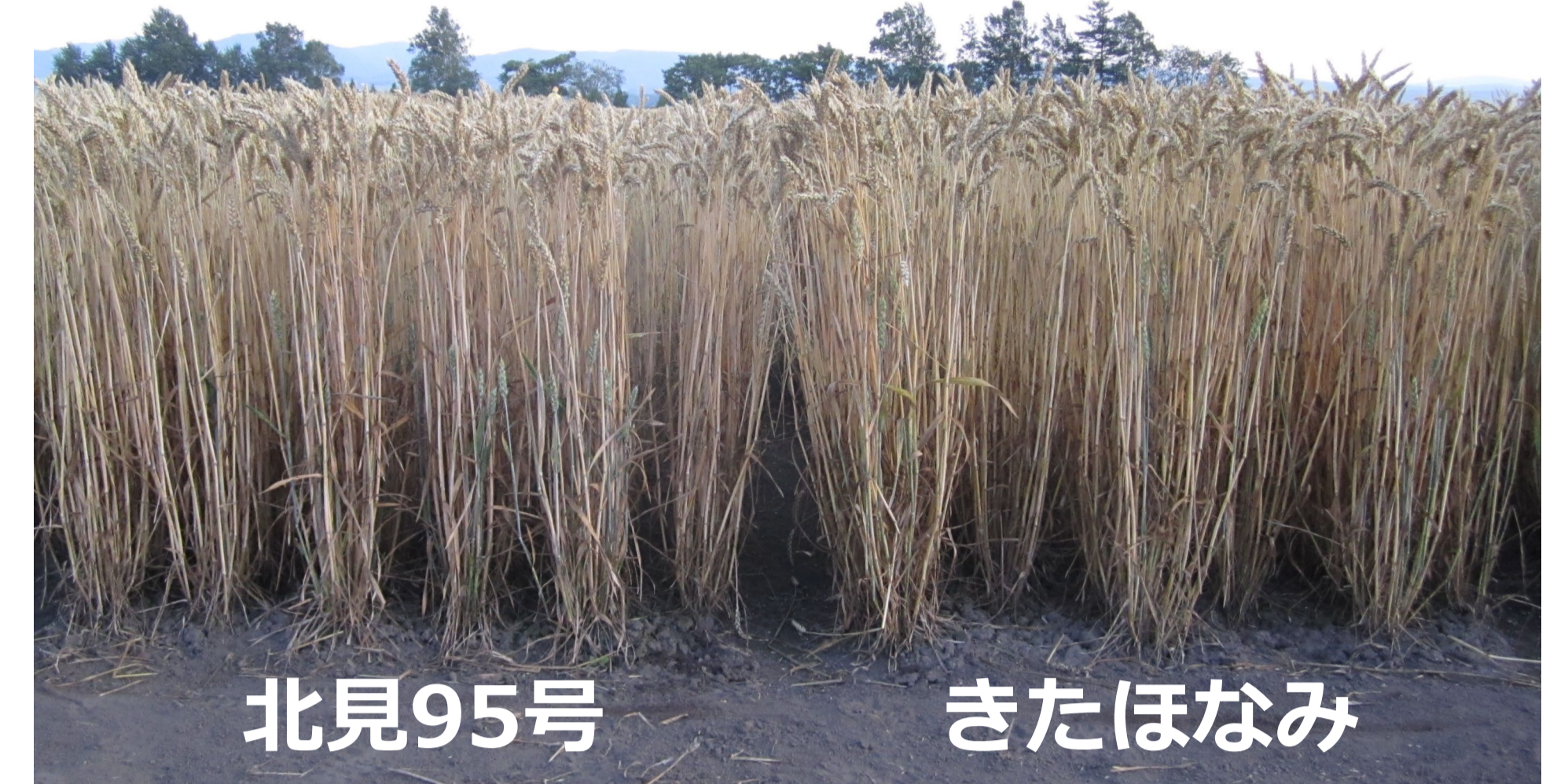
北見95号 きたほなみ 成熟期の草姿