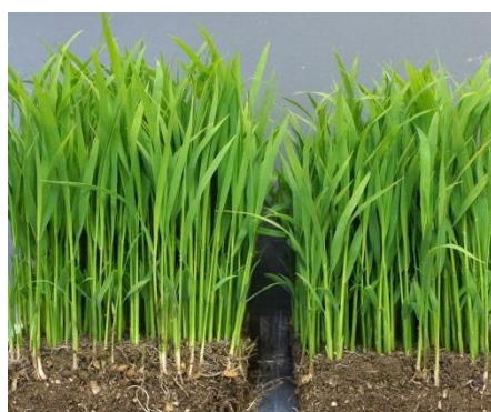
写真1 移植時苗の例 (左：密播中苗、右：慣行中苗)