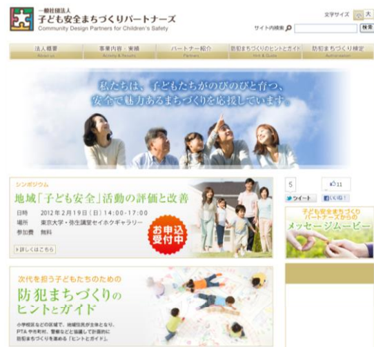
図2 立ち上げたポータルサイト画面 http://kodomo-anzen.org/