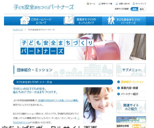
図2 立ち上げたポータルサイト画面 http://kodomo-anzen.org/index.html