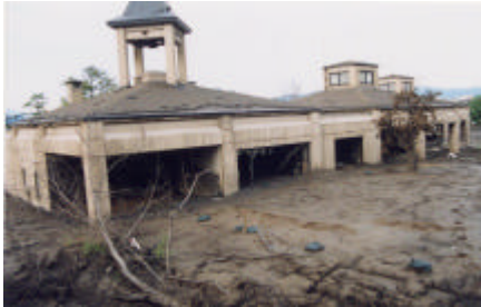
熱泥流により被害を受けた建物

研究の目的 2000年有珠山噴火災害により都市や建物は大きな被害を受けました。この研究では、建築被害の原因を分析し、地域や住宅の復興の課題を整理します。