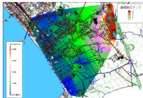
地殻の変動量(GISマップ)

活用方法・成果 火山災害によりリスクマップ(被害予測図)の作成や、道内の活火山の防災対策に活用していきます。また、本研究成果を更に発展させた研究を今年度から実施予定です。