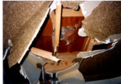
噴石により被害を受けた建物

研究の結果 建築被災度調査の結果をもとにGIS(地理情報システム)マップを作成しました。その結果、地殻の変動量と基礎被害の間に一定の関係があることや、噴石・降灰による建物被害の原因がわかりました。また、アンケート調査により、被害調査に対する住民の希望を把握することができ、住宅の復興における課題を整理しました。