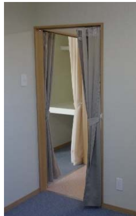
入口のカーテンを開ける

ストーブを25℃に設定し、カーテンを開けたままにすると各室の温度は以下の様になりました（一例）。