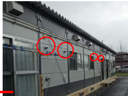
南側外壁の 外気の入入れ口の位置