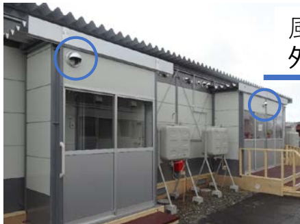
風除室側の 外気の入入れ口の位置

応急仮設住宅は、常時空気の入れ替え（換気）をしています。そのため、建物の外壁には、南側（●印）と風除室側（●印）に外気の入入れ口があります。屋外にある●、●印の外気の入入れ口近くにタバコなど臭いの発生があると、室内に吸い込まれ、室内で臭いがします。