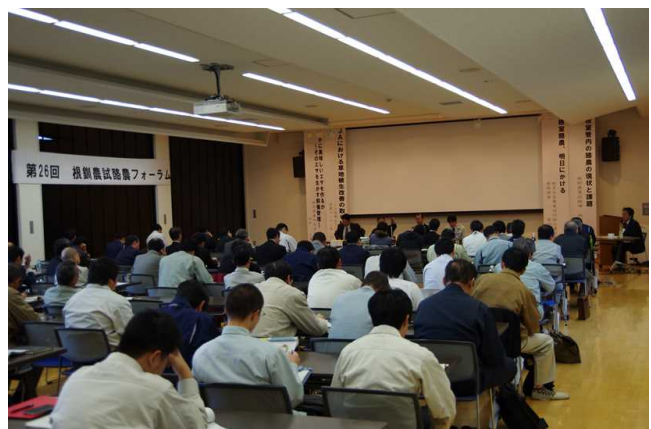
第26回酪農フォーラム