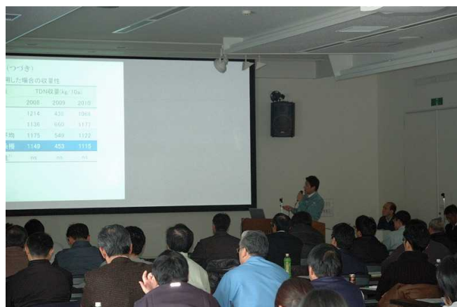
平成 25 年根釧農業新技術発表会