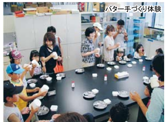
バター手づくり体験