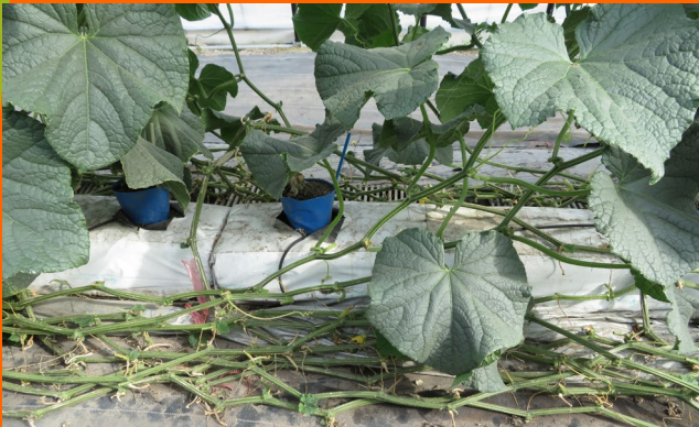
きゅうりの栽培事例 鷹栖町あったかファーム