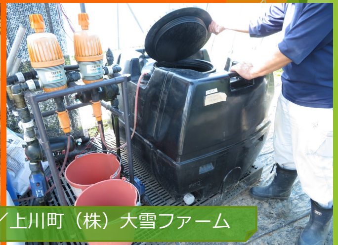
ミニトマトの栽培事例 / 上川町 (株)大雪ファーム