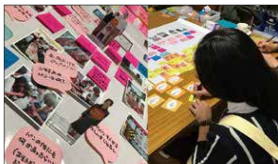
ケーススタディでのf-UX手法試行