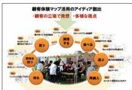
幅広い顧客体験を考慮したアイデア創出