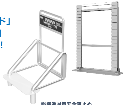
誤発進対策安全車止め 「バリアーピット！」(トライ・ユー(株))