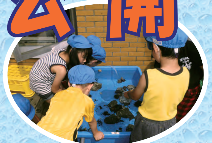
海の生き物にさわってみよう