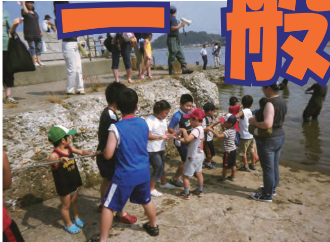
みんなで力を合わせて網をひこう