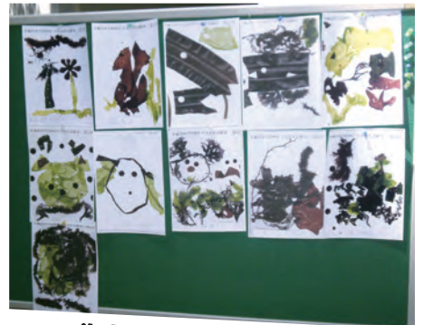
海藻で絵をかいてみよう