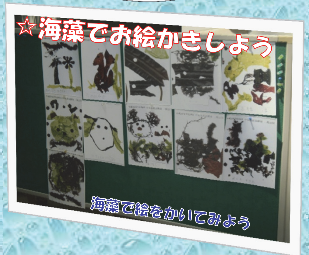
海藻で絵をかいてみよう