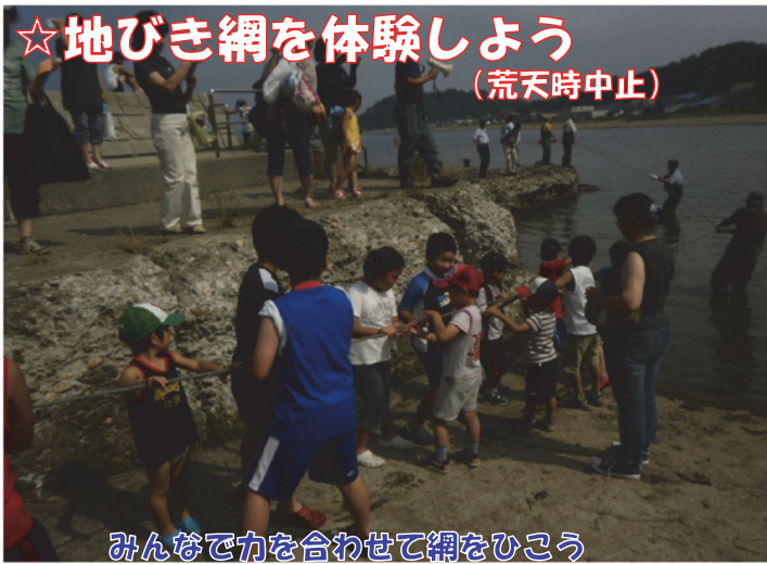
みんなで力を合わせて網をひこう