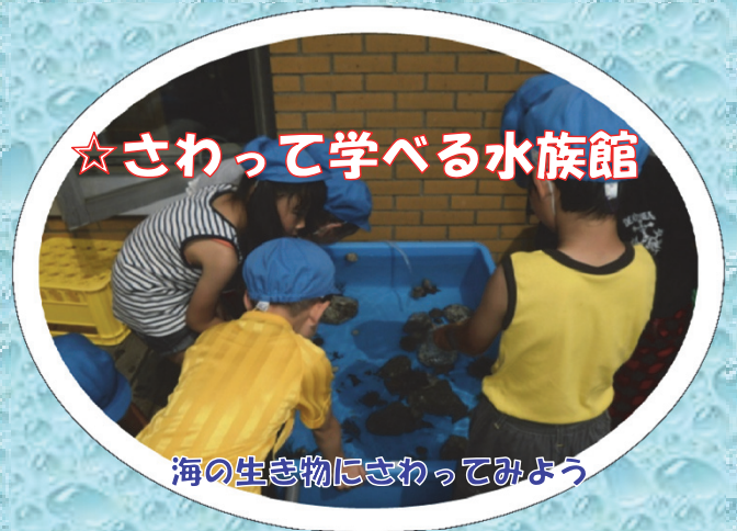
海の生き物にさわってみよう