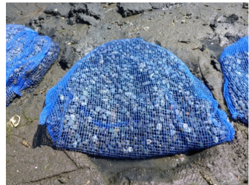
写真1 使用した砂利入り網袋

2017年5月下旬に能取湖東岸の干潟域において、粒径9～11mmの砂利5kgを詰めたナイロン網袋※ 2 （網目4mm、写真1）を海岸線と平行に敷設しました。その後、網袋の効果を把握するために、年に2～3回それぞれ網袋4袋の回収と周辺での方形枠を使用した底土の採取（4枠）を実施しました。網袋の内容物と採取した底土は1mm目合いのふるいでアサリを選別し、アサリ個体数の計数と殻長の測定を行いました。