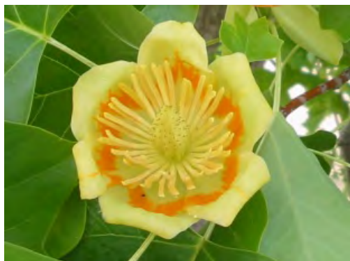
ユリノキ 別名：チューリップツリー、ハンテンボク ◎モクレン科

北アメリカ原産で、名前は Liriodendron （「ユリの木」を意味する学名）に由来しています。花がチューリップに似ていることから「チューリップツリー」、また葉が服の「はんてん」に似ていることから「ハンテンボク」ともいわれます。