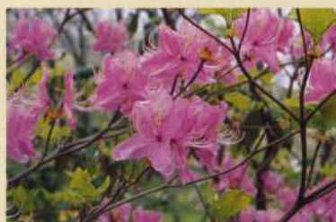
ヒダカミツバツツジ

ヒダカミツバツツジは、日高地方の一部だけにみられます。サカイツツジは、日本では根室地方の湿原にみられます。どちらも珍しいツツジですので、大切に保護する必要があります。