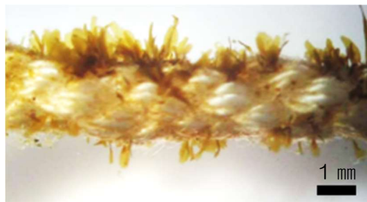
写真 1 有機栽培用のワカメ種苗。沖出し後に10日間仮殖した種苗。

もうひとつの問題は生産方法です。当時はEUやカナダなどの海外の規格を参考にする他なく、養殖試験は手探り状態で開始することになりました。有機藻類の生産には、環境や生態系の保全への配慮が求められており、それらに負荷をかける可能性がある行為やその原因となり得る資材類の使用が制限されています。海藻類の養殖は海中で行われますが、種苗生産は陸上の施設で行われることが多く、種苗は水槽内で培養されます。海中には海藻類の生長に必要な栄養塩類が含まれていますが、止水条件下ではすぐに枯渇してしまいます。そのため、一般に種苗の育成には人工的に合成された栄養剤を添加した海水（培養液）が使用されます。しかし、有機藻類の生産には化学薬品等の使用は認められていないので、種苗生産に培養液を使用