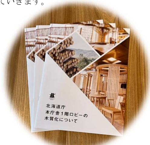
写真1 パンフレット

今後、木造化木質化を検討する際の参考にしていただくことで、建築物における北海道産木材の利用を促進していきます。