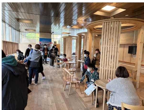
写真2 道庁1階ロビー (令和4年10月に開催した親子見学会)