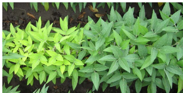
「スズマル」 「中育69号」 センチュウ発生圃場での生育状況 (「スズマル」は葉が黄化)