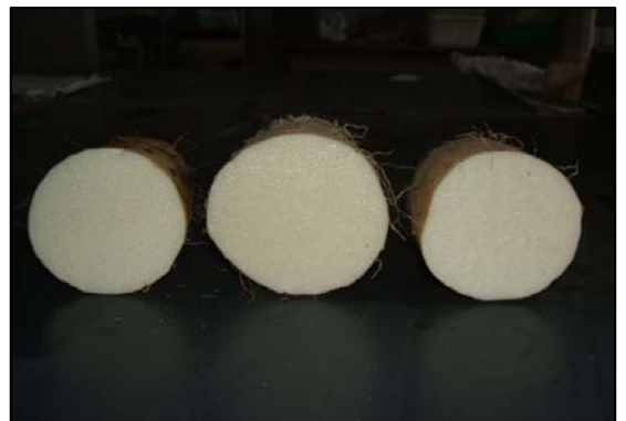
「音更選抜」 「十勝4号」 「川西選抜」

「十勝4号」のいも形状(上:全体 下:切断面) (サンプルは平成24年帯広市産)