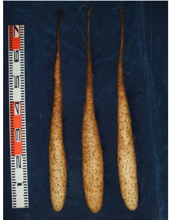
「音更選抜」 「十勝4号」 「川西選抜」