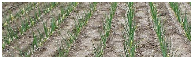
写真 移植後4週目の分施直後 (白い粒が硝酸カルシウム)

分施 ：養分吸収パターンへの対応を目的に、全施肥量の一部を生育途中に計画的に施用する施肥法 追肥 ：多量降雨によって肥料ロスが生じた場合などに、養分不足を応急的に補うために行う施肥法