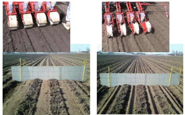
一般的な平滑鎮圧輪