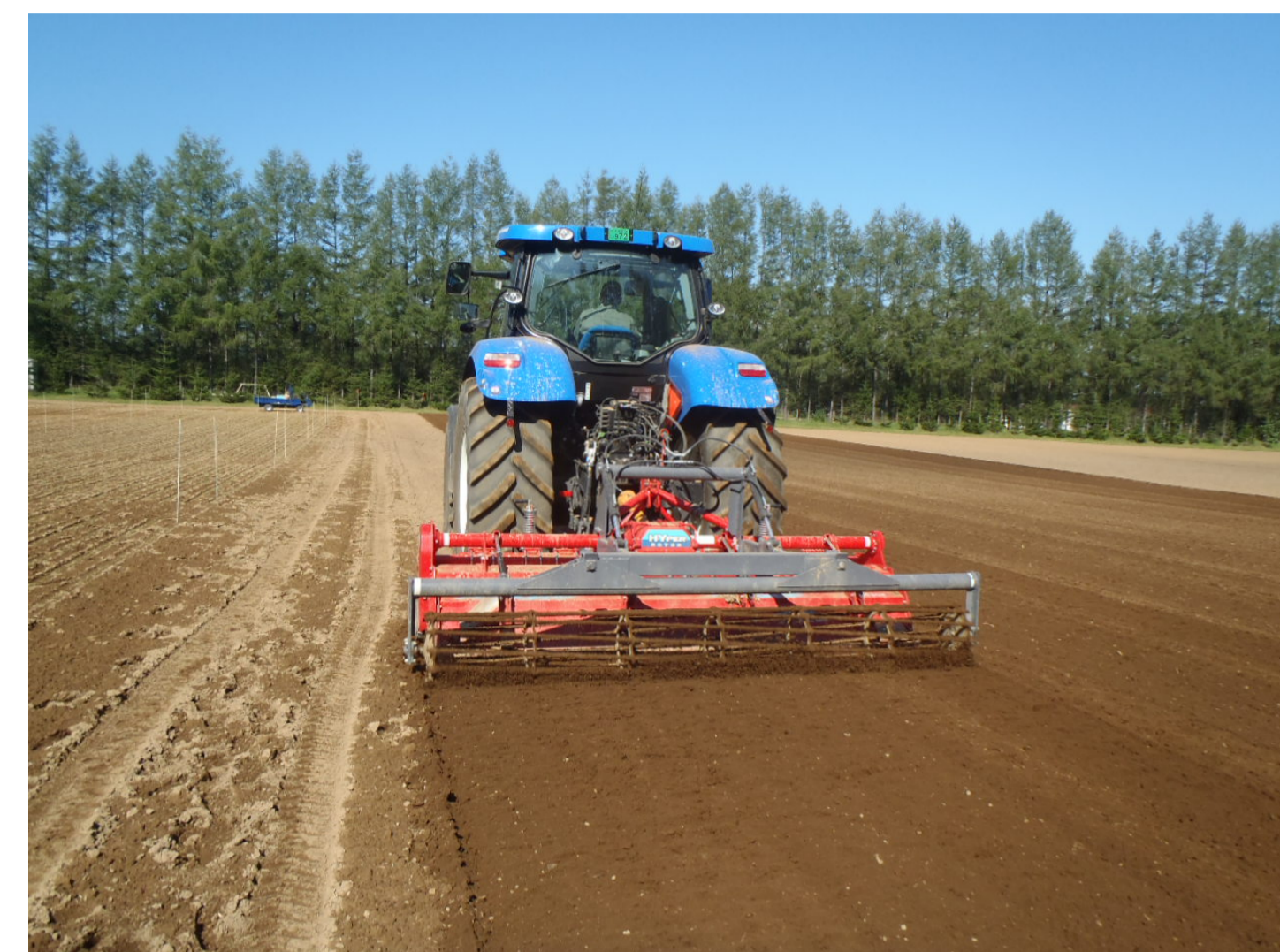
ロータリーハローによる 混和 （深さ約15cm）