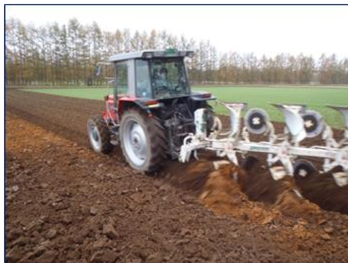
プラウによる 反転 （深さ約27cm）

そこで、堆肥をまくタイミング（ 春 、 秋 ）と土との混ぜ方（ 反転 、 混和 ）によって堆肥の効き目がどのように違うか明らかにしました。