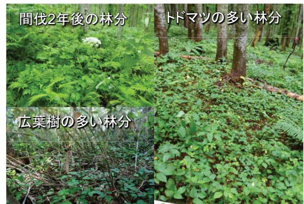
図2 伐採前の多様な林床植生