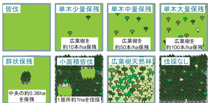
図1 8通りの実験区 伐採後にはトドマツを植栽します

森林所有者にとってコスト増となる保残伐施業をどうすれば普及させることができるか、環境経済学的な研究にも取り組んでいきます。