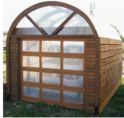
小断面わん曲集成材を使ったガレージ （株）日本ドアコーポレーション