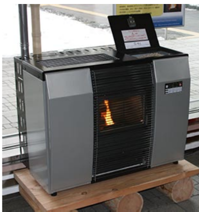
北海道型ペレットストーブ（株）サンポット