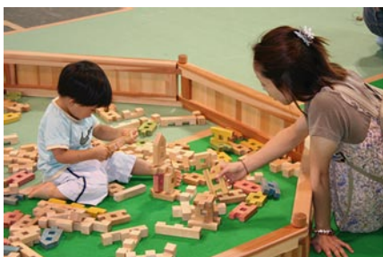
親子で木のブロックづくり