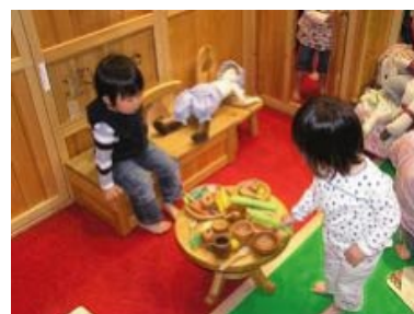
ままごとのできる「ごっこハウス」