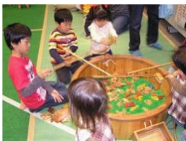
木の魚を磁石で釣る「魚釣り」

道では、木が持つぬくもりや魅力は、子どもをはじめとする人々の心や体を育む「ゆりかご」であるとの考えに基づき、子どもたちの健やかな成長と豊かな心を育むため、「木のおもちゃ」に親子でふれ親しむ機会を「わくわく！木育（もくいく）ランド」で提供してきました。また、人と木や森との関わり、森林づくりの大切さについての講演会も併せて開催しました。