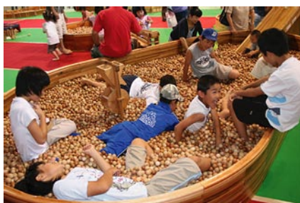
木の砂場で遊ぶ子どもたち