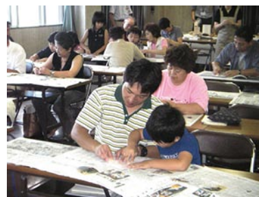
木のマグネットづくり（美幌）