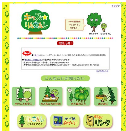
図1 「キッズ☆りんさんし」のトップページ

トップページに次の四分野(●)の入り口があり、そこからそれぞれの項目(○)に行けるようになっています。