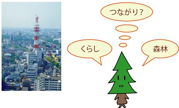
図3 「木と森のこと」の1コマ