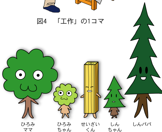
図5 林産試験場のオリジナルキャラクター

このほか、林産試験場の業務内容と研究について紹介するページ(近日中に公開予定)、木や森林に関する子ども向けホームページなどへのリンク集があります。