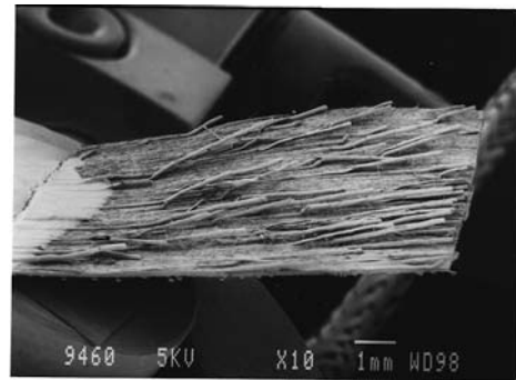
図2 道管内で硬化した接着剤の電子顕微鏡写真

剤が流れやすいうちに圧力を加えることにより、木材の空隙に接着剤が入り込みます。固定にはクランプやはたがねのような専用治具もありますが、輪ゴム、あるいはテープやヒモでもかまいません。