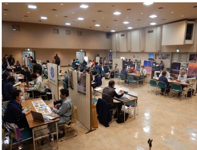
【昨年度の合同企業説明会の様子】