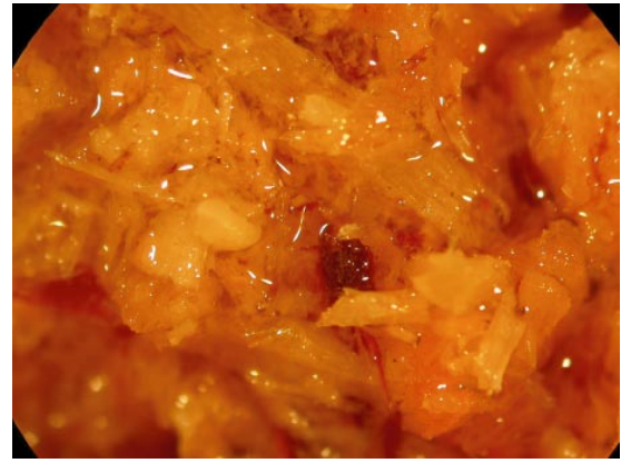
写真2 カラマツの乾燥おが粉（左）と最大保水状態（右）

く流れて表面に溜まらないなどの点で優れています。 写真2はカラマツおが粉とその最大保水状態の実体顕微鏡写真です。写真右では水が浮いている状態に見えますが、この状態でも水が流れ出すことはありません。ただし、このような状態では家畜に付きますし、高く積み上げることはできず、また、搾ると水が出てきます。