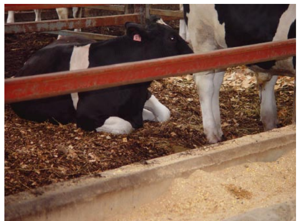
写真1 牛舎で使用されている敷料（左：通路に敷かれたカラマツおが粉、右：カールマットの戻し利用）