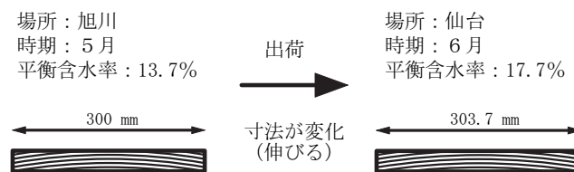
図2 ヤチダモ板目材の寸法変化例