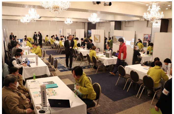
【昨年度の合同企業説会の様子】