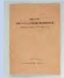
写真 - 1 被害調査 報告書