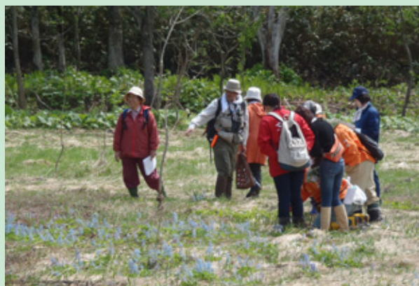
写真-1 現地での野外ワークショップの様子 植栽予定地について学ぶ