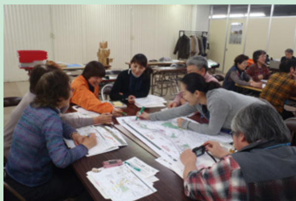
写真-2 屋内でのワークショップの様子 次年度以降の植栽樹種を決めるための グループでの話し合い