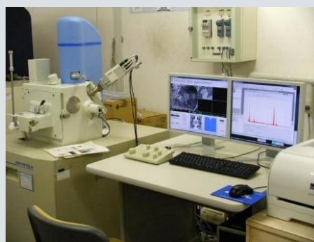
種々の機器分析により鉱物の優位性を発見