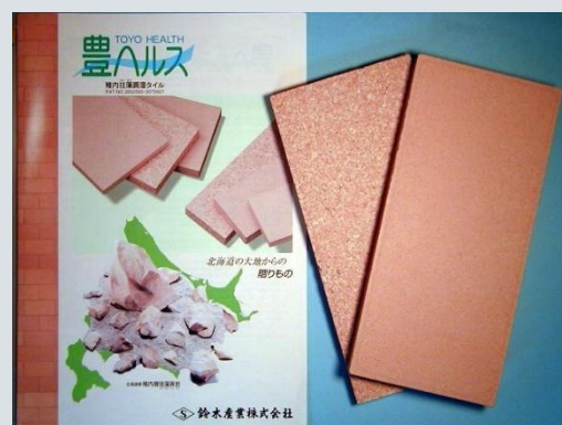
調湿タイル 特許第2652593号