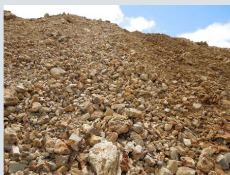
道北で採掘される稚内層珪質頁岩