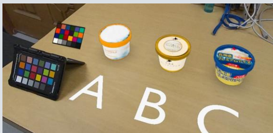
XR表示による パッケージデザイン検討 (左端は色参照用カラーチャート)