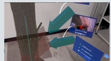
XRで作業のポイントを表現