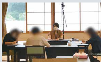
グループインタビュー