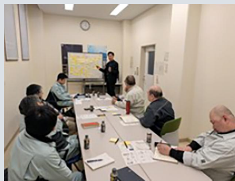
自社の将来ビジョン・経営理念の検討