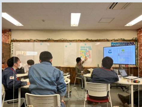
地域エネルギーの未来像探索