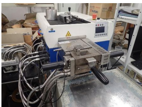
バッチ式熔融混練機