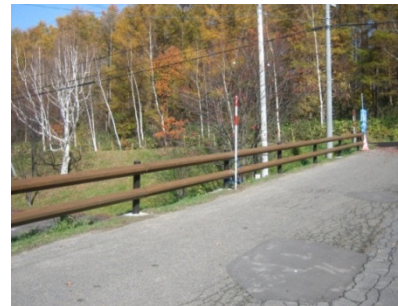
写真2 ひがしかぐら森林公園への設置例

自然景観との親和性、木材によるCO 2 固定や他素材に比べて小さい加工エネルギーなどの環境性能、地材地消による地域への経済波及効果など、木製ガードレールは従来の鋼製ガードレールに比べてメリットが大きく、平成22年10月1日に施行された「公共建築物等における木材の利用の促進に関する法律 (公共建築物等木材利用促進法)」にも木製ガードレールの活用について記載されたことから、全国的に観光地の景観整備や地域おこしに活用する機運が高まっています。