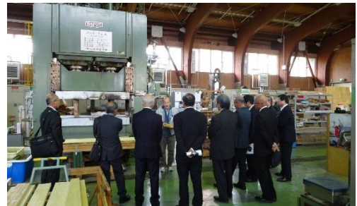
【視察の様子(圧縮木材)】

10月14日（金）、全国工業高等専門学校校長10名ほかの訪問を受け、CNC木工旋盤の実演や、圧縮木材、カラマツ建築材（コアドライ®）やシラカンバ内装材、木と暮らしの情報館、コロポックルなどをご覧いただきました。