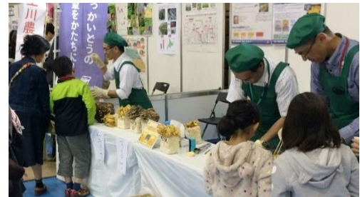
【催しの様子(きのこの展示・試食)】

10月9日（日）、旭川地場産業振興センター（旭川市神楽4条6丁目）において、「コープさっぽろ 食べる・たいせつフェスティバル2016 in 旭川」が開催されました。林産試験場はキノコの研究成果や機能性について展示すると共にマイタケやムキタケの試食を行いました。