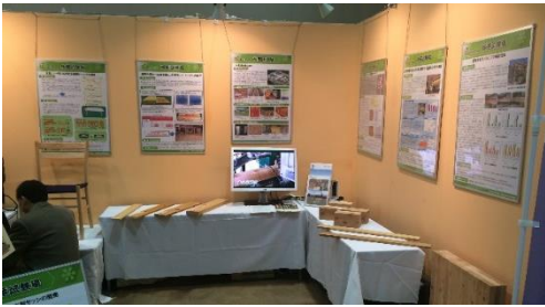
【昨年度の展示の様子】

11月10日（木）～11日（金）、アクセスサッポロ（札幌市白石区流通センター4丁目）において「繋がる！北海道新時代～aggressiveに突き進め！～」をキーワードに『ビジネスEXPO「第30回 北海道 技術・ビジネス交流会」』が開催されます（主催：北海道経済産業局ほか）。林産試験場は道総研ブースの一員として、カラマツ建築材（コアドライ®）や道産CLT等の研究成果品を出展する予定です。