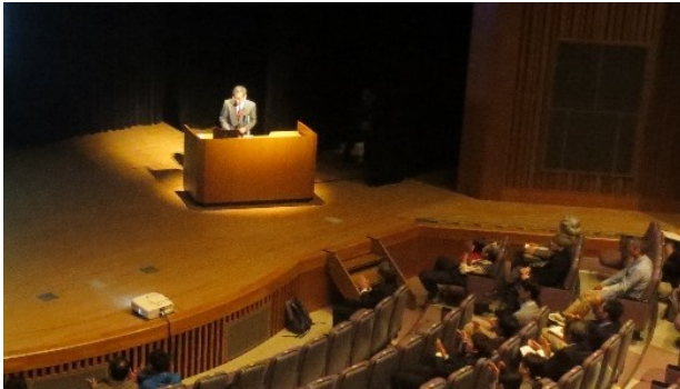
【口頭発表の様子（昨年）】

なお、本発表会は（一社）森林・自然環境技術者 教育会（JAFEE）のCPDプログラムに認定されてい ます。当日会場にてCPDの受付をいたします。