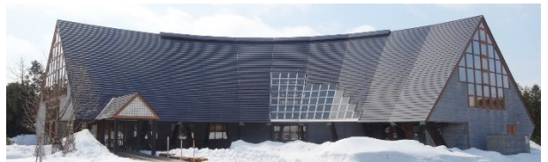
【木と暮らしの情報館】

また、ログハウス「木路歩来（コロポックル）」 は4月27日（土）から開館の予定です。