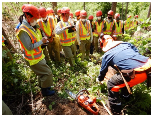
【飯田氏が実践している伐倒方法の説明】