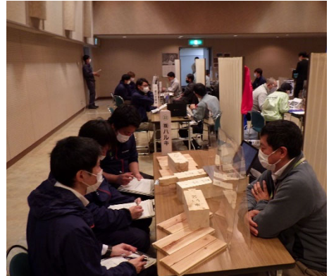
【企業・団体等のブース】