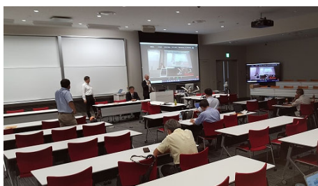
写真1 研究発表会場

第18回大会は、林野庁および立命館大学サステイナビリティ学研究センターの後援があり、日本バイ