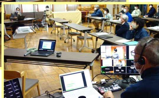
オンライン化された職場研修（専門研修「森林・木材研究の動向と研究マネジメント」）