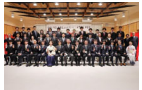
【卒業生の集合写真】