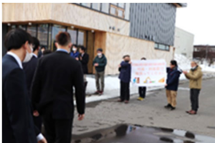
【林産試験場のみなさんからのエール】