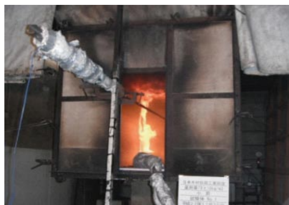
写真1 模型箱試験の様子

写真 1 は、薬剤処理をしたスギ材を試験材料に用いた例です。試験の評価は、「①燃焼しないこと」については、酸素消費量から算出した発熱速度および総発熱量を基に、「②防火上有害な変形、溶融、亀裂、その他の損傷を生じないこと」については、加熱終了後の試験体の状況を基に行います。また、「③避難上有害な煙、又はガスを生じないこと」を評価するガス有害性試験は、材料を一定条件で加熱し、発生するガス